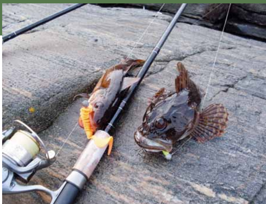
Наградила же природа такой «физиономией»!

сквозь прозрачную толщу воды. На поверхности едва шевелила щупальцами ушастая медуза. Кое-где мелькали колонии мидий. Рыб замечено не было.