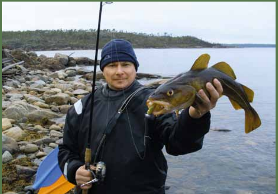
Такой экземпляр может какое-то время спокойно тащить байдарку вместе с гребцами

Из бухты неподалеку показалась моторная лодка. Местные коллеги подошли к нам на «Казанке» с пятицилиндровым мотором. Изрядно подивившись нашему суденышку, похвастались своим уловом. Шесть или семь морских окуней, пойманных с глубины около 35 метров. Снасть коллег была очень проста: можжевелевый короткий удильник