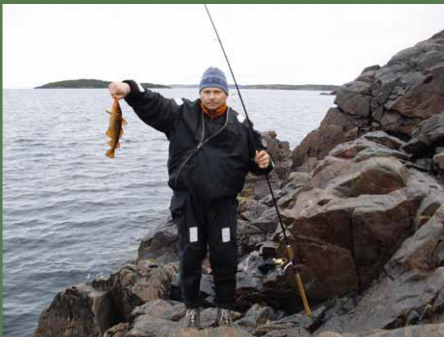
Ура, мы с ухой! Можно и попозировать