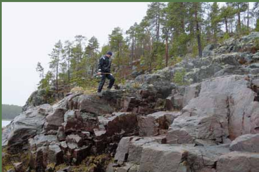
Ровная асфальтированная дорожка к увалистому прикормленному местечку на пруду