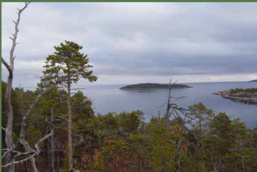
Острова везения в Белом море есть