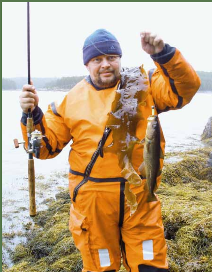
И треска, и лист капустный. Мы варили — было вкусно