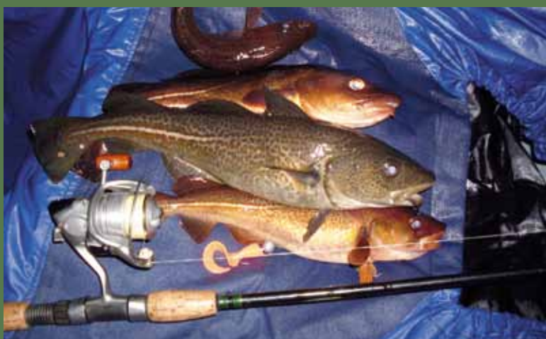
Привет, карельская треска!

— А-а! Щемишь еще, а я уже давно в делах. Ну что, едем?!