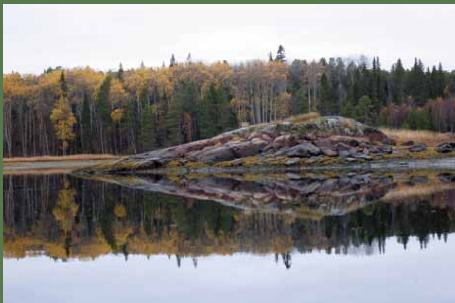
На валуне еще никого не видно? Не такой уж он и округлый при полном отливе

доносились вой ветра и дробный стук дождевых капель. «Дружище доктор Фрейд позабавился бы», — мелькнуло в голове.